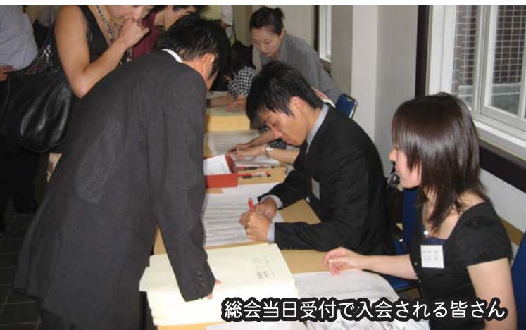
総会当日受付で入会される皆さん