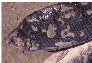
図. 1 ミズカビに感染されたマス

本セミナーでは、特異的な作用を示す抗菌物質の創製を目指す第一歩として、放線菌 Streptomyces sp. TK08046 が生産するサブロルマイシンの生合成遺伝子群の取得と同定を行った研究成果 [2] について紹介すると共に今後の展望についても紹介する予定である。