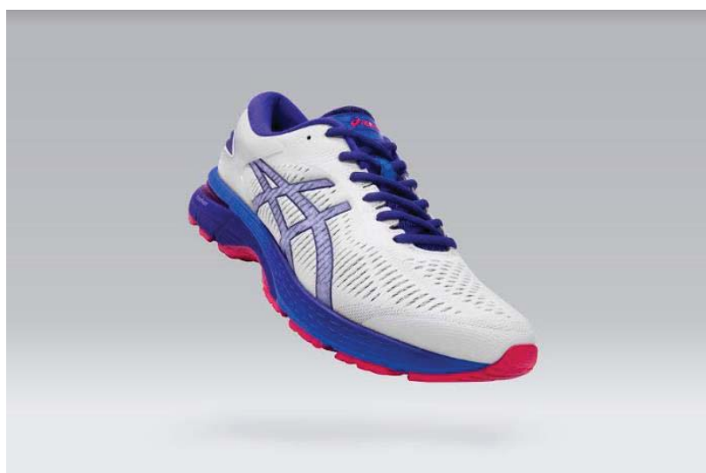
GEL-KAYANO 25

このたび、星光PMC株式会社のセルロースナノファイバー（CNF）複合材料“STARCEL®”が総合スポーツ用品メーカーである株式会社アシックス様の高機能ランニングシューズ製品「GEL-KAYANO 25（ゲルカヤノ 25）」のミッドソール部材の原材料の一部に採用されました。GEL-KAYANOシリーズは、25年に渡り世界のランナーから注目され、愛され続けてきたランニングシューズです。GEL-KAYANO 25のミッドソール（甲被と靴底の間の中間クッション材）には軽量性と耐久性という相反する機能を高次元で両立させた新たなスポンジ材「FlyteFoam Lyte（フライトフォームライト）」が使われており、この原材料の一部にCNF複合材料“STARCEL®”が使用されています。株式会社アシックス様の発泡成形技術と当社のSTARCEL®製造技術のコラボレーションにより、世界初のCNF強化樹脂応用製品の商品化が実現しました。