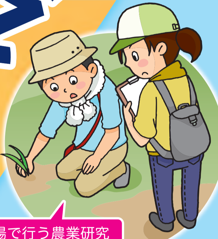
現場で行う農業研究