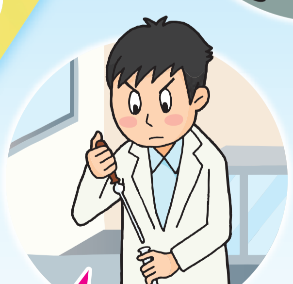
基礎研究を現場に!