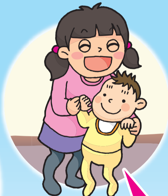
笑顔で生活するために