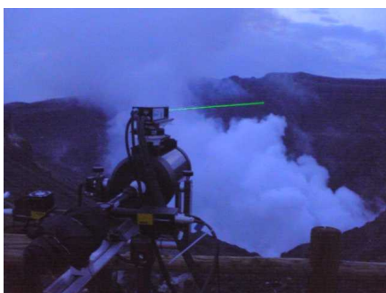
図 3. 阿蘇におけるライダー観測.