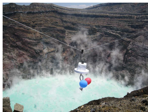
図 2. テレメトリー・ブイの設置作業.